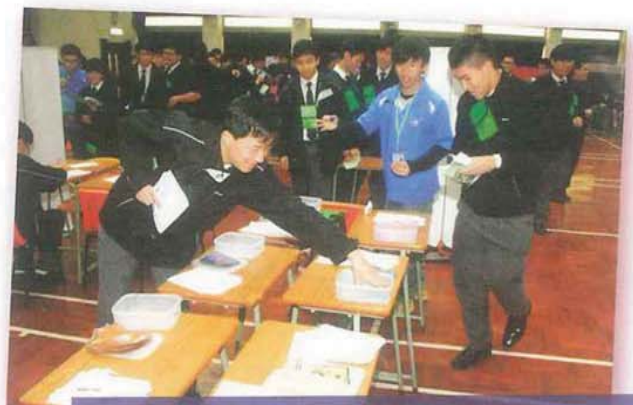
在「初級廚師」活動中，學生正挑選「材料」做菜