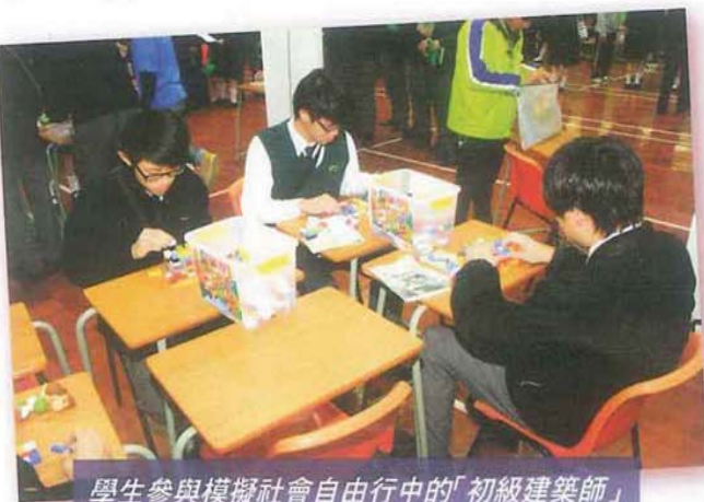
學生參與模擬社會自由行之中的「初級建築師」

今次活動不但讓中六同學減少了面對出路而產生的焦慮，更可提醒他們及早訂立目標，籌謀出路。